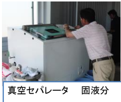
真空セパレータ 固液分